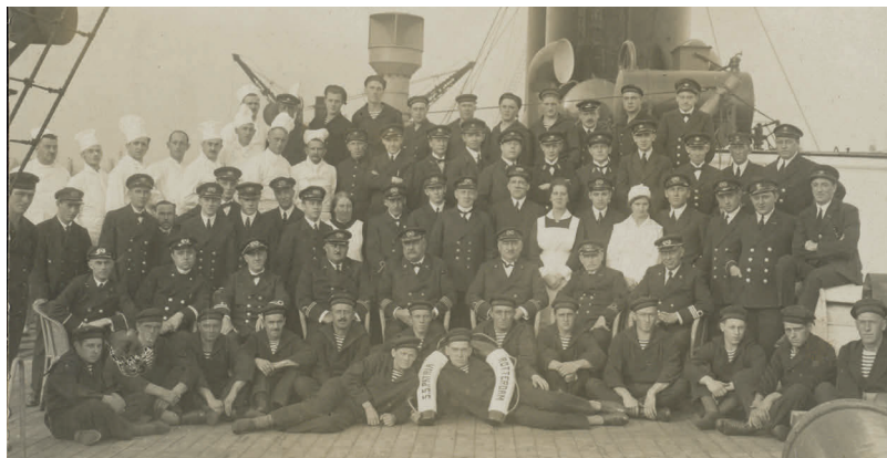
3 Voltallige bemanningposeert aan dek van het passagierschip Patria van de Rotterdamsche Lloyd, circa 1919-1920. Collectie Maritiem Museum, objectnummer F38470

Ook aan boord van de Patria, die in 1919 voor de Rotterdamsche Lloyd in de vaart kwam, waren vrouwen onder de bemanning. Ze vallen op de foto vooral op doordat zij – behalve de koks – (deels) in het wit gekleed zijn. Ziet u ze staan?