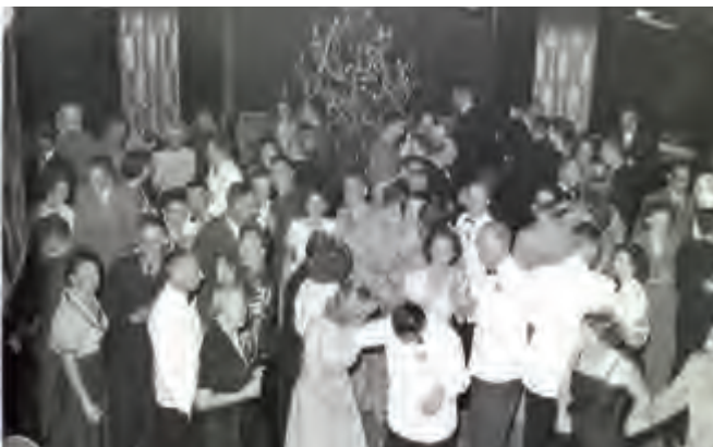
Kerstbal aan boord van de 'Willem Ruys' (Koninklijke Rotterdamsche Lloyd), jaren vijftig.

Het Comité Kerstfeest op Zee van de Nederlandse Zeemans Centrale verzorgt al decennialang kerstpakketten, om alle zeevarenden te laten weten dat ze niet vergeten worden. Zo vonden maar liefst 4117 zeelieden op 289 schepen van 25 Nederlandse rederijen met Kerst 2012 een cadeautje onder de kerstboom. Een enthousiaste journalist schreef in 1948: "Er zijn twee mogelijkheden om onze mannen en jongens ter koopvaardij een goede