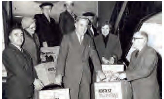
Kerstkisten worden aan boord van de 'Willem Ruys' gebracht, jaren vijftig.