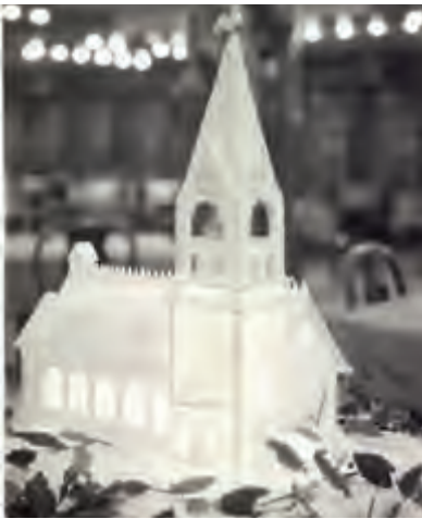
Een kathedraal van suiker aan boord van de 'Baloeran' (Rotterdamsche Lloyd), jaren dertig.

Kerstmis wordt niet alleen aan wal gevierd, maar ook op zee. Met name op passagiersschepen wordt fors uitgepakt om het feest nét zo gezellig en feestelijk te maken als thuis, en dat is al zo sinds de komst van de passagiersvaart aan het eind van de 19de eeuw. De tafels in de eetsalons van toen en de restaurants van nu worden op Eerste Kerstdag uitbundig versierd met hulsttakken, kaarsen en kerststukjes en eten is er in overvloed. Zo werden in Rotterdam in 1923 tientallen kerstbomen, allerhande kerstversiering en enorme hoeveelheden eten aan boord van de 'Berengaria' gebracht, gadeslagen door een verlekkeerde journalist die schreef: "Op de Berengaria zullen tijdens de kerstdagen de eettafels "versierd" zijn met 150 kalkoenen, 100 ganzen, 250 eenden en last but not least 500 plumpuddings". De rijke buffetten werden naar een hoger plan gebracht met indrukwekkende bouwwerken van suiker, die door de eigen patissiers waren gemaakt.