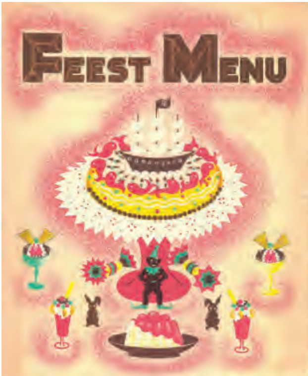
Kindermenukaart van de 'Indrapoera'