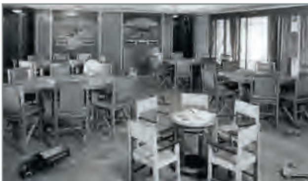
Kinderkamers aan boord van de 'Dempo' en de 'Oranje'.