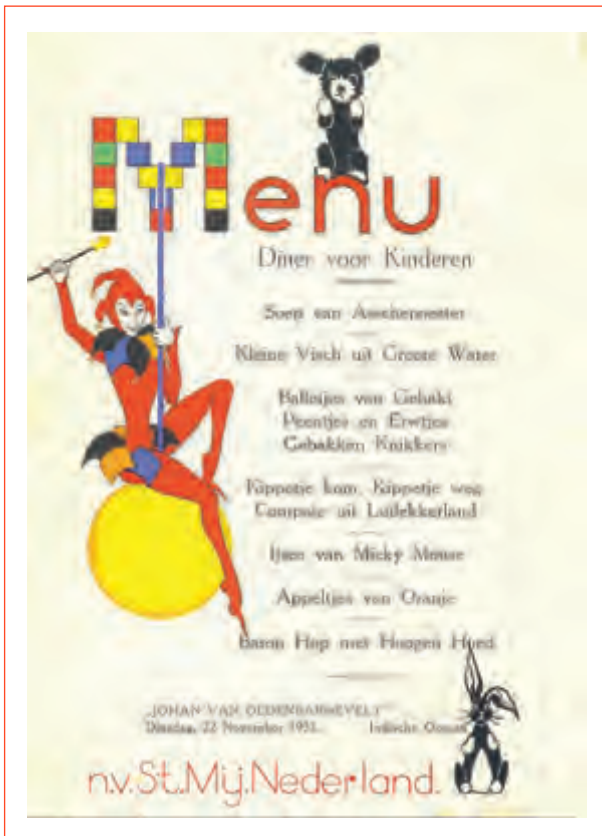
Kindermenukaart van de 'Johan van Oldebarnevelt'

Wist u, dat er aan boord van elk passagiersschip vroeger een kinderkamer was? Die was onderdeel van de eerste klas accommodaties, hoewel enkele schepen ook een tweede klas kinderkamer hadden. In die kinderkamers werden de kinderen de hele dag vermaakt met spelletjes of