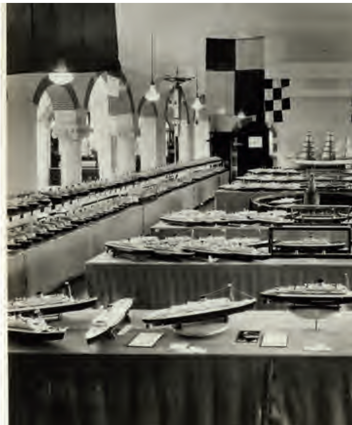
Tentoonstelling met inzendingen voor de modelbouwwedstrijd in het Koloniaal Instituut te Amsterdam. Foto door M.C. Meyboom, Amsterdam, 1938. Het Scheepvaartmuseum, S.4890 b

Dat het bouwen van een varend model van de Oranje geen solitaire bezigheid hoeft te zijn, blijkt uit de berichten over verschillende modelbouwclubs. Deze clubs zijn in de jaren