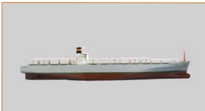
'Nedlloyd Houtman', collectie Maritiem Museum Rotterdam, objectnummer N99.