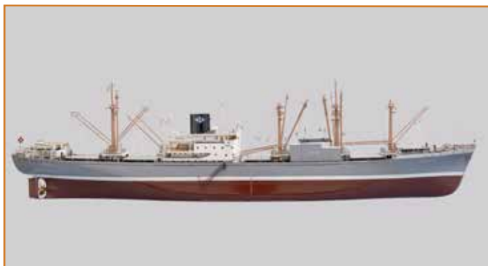
'Marne Lloyd', collectie Maritiem Museum Rotterdam, objectnummer N1167.

Vier bij de RDM, twee bij Wilton Fijenoord en twee - waaronder deze 'Marne Lloyd' - bij Van der Giessen en Zonen. Het schip, bouwnummer 783, werd op 13 april 1957 opgeleverd en had een laadvermogen van 9.600 ton. Alle schepen in deze serie hadden een kruissnelheid van 21 knopen - de 'Marne Lloyd' was voorzien van een 9-cylinder Sulzer diesel van 10.500 pk - wat ervoor zorgde dat ze lange tijd de snelste koopvaardijsschepen in de Nederlandse vloot waren. De 'Marne Lloyd' had accommodatie voor ongeveer 70 bemanningsleden, maar ook zes hutten voor twaalf passagiers, die konden beschikken over een eigen eetkamer en een rooksalon. De 'Marne Lloyd' heeft lang dienst gedaan. In 1970 werd het ingelijfd bij Nedlloyd en in 1977 kwam het onder de naam 'Nedlloyd Marne' in bedrijf bij de Nedlloyd lijndiensten. Een jaar later kwam het onder de naam 'Kota Jasa' onder Singaporese vlag om tenslotte in 1983 in Dalian (China) te worden gesloopt.