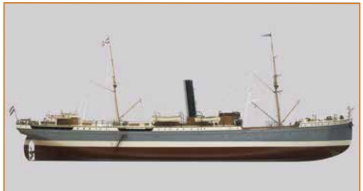
'Ardjoeno', collectie Maritiem Museum Rotterdam, objectnummer M1323. Fotografie Bertel Kolthof

Het derde 'Nedlloyd-gerelateerde' schip op die wand is de nummer drie na de 'Padmos/Blijdorp': het s.s. 'Ardjoeno' van de – toen nog niet koninklijke – Rotterdamsche Lloyd. Het is in 1891 gebouwd door de werf De Schelde in Vlissingen onder bouwnummer 73. De 'Ardjoeno' was een vrachtschip bedoeld voor de maildienst tussen Rotterdam en Batavia en had tevens accommodatie voor 117 passagiers in een eerste, tweede en derde klasse. De 'Ardjoeno' was voorzien van een 1800 ipk stoommachine die het schip een kruissnelheid gaf van 12 knopen. Het schip is in 1908 verkocht aan P. Cozzika & Co in Piraeus (Griekenland) en deed daar dienst onder de naam 'Margiora'. In 1912 werd het overgenomen door de Compagnie de Navigation Mixte in Marseille (Frankrijk) en kreeg het de naam 'Mansoura'. In 1923 is het schip gesloopt in het Italiaanse Genua.